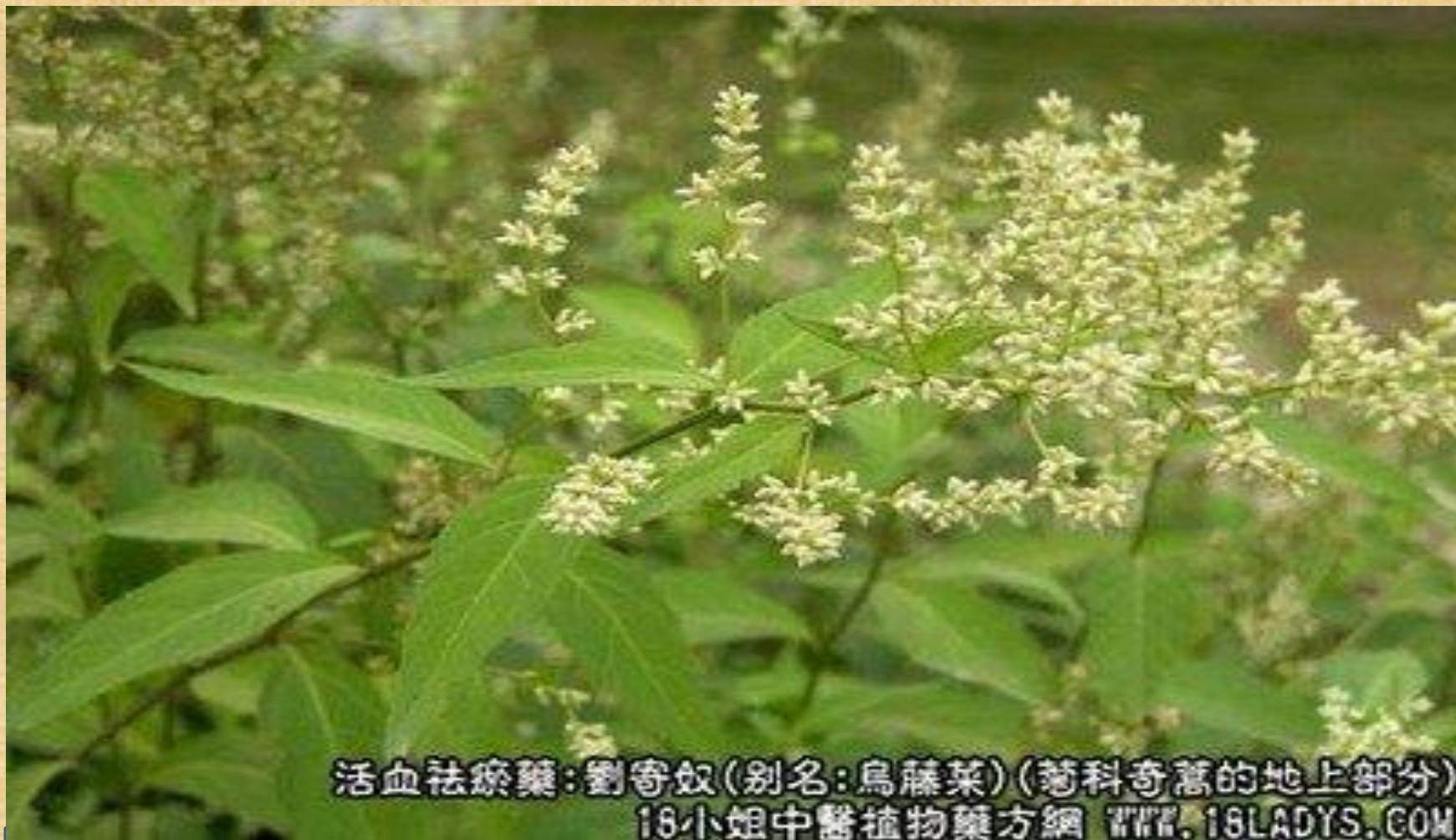
活血祛瘀藥：劉寄奴(別名：烏藤菜)(莚科奇蒿的地上部分) 16小姐中醫植物藥方網 WWW.16LADYS.COM

刘寄奴草并非只能用来治疗跌打损伤，作为一种富有活血和通经能量的药草，它能够治疗痛经和产后腹痛、恶露不尽，还能借由活络气血而改善风湿痹痛，并能帮助血液畅通从而治疗便血和尿血，痈疮肿毒亦不在话下。