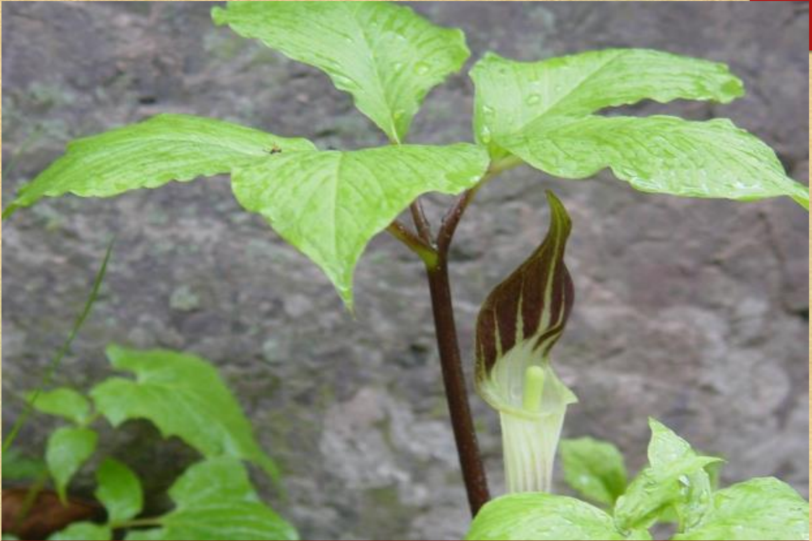
东北南星，叶片鸟足状分裂，裂片5，侧裂片具有共同的柄，与中裂片近等大。佛焰苞管部漏斗状，白绿色，喉部边缘斜截形。