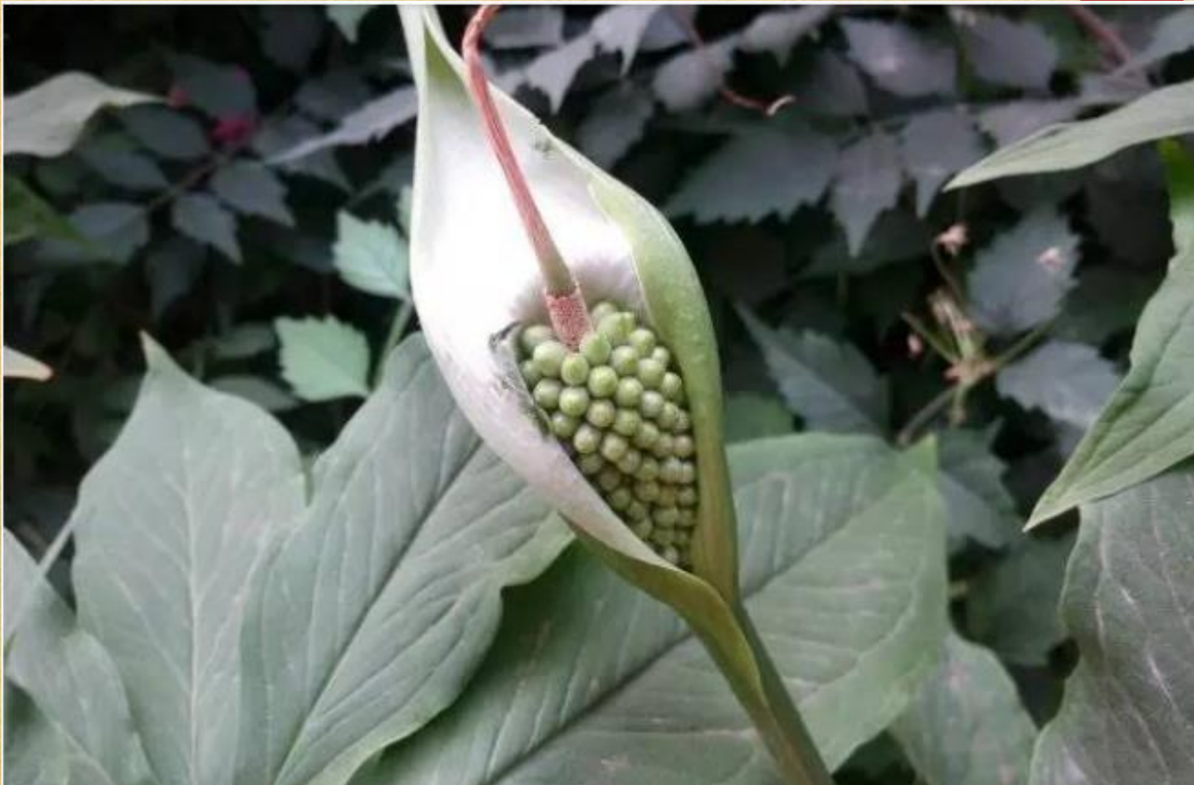
虎掌浆果卵圆形，绿色至黄白色，小。