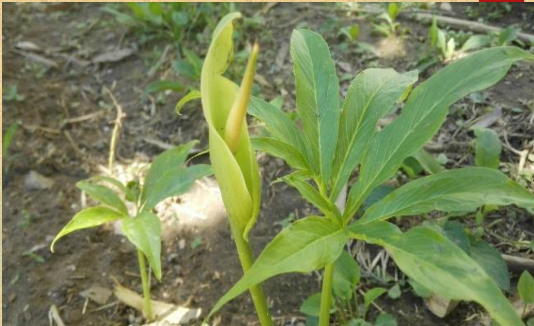
虎掌佛焰包淡绿色，管部长圆形，檐部披针形，锐尖。