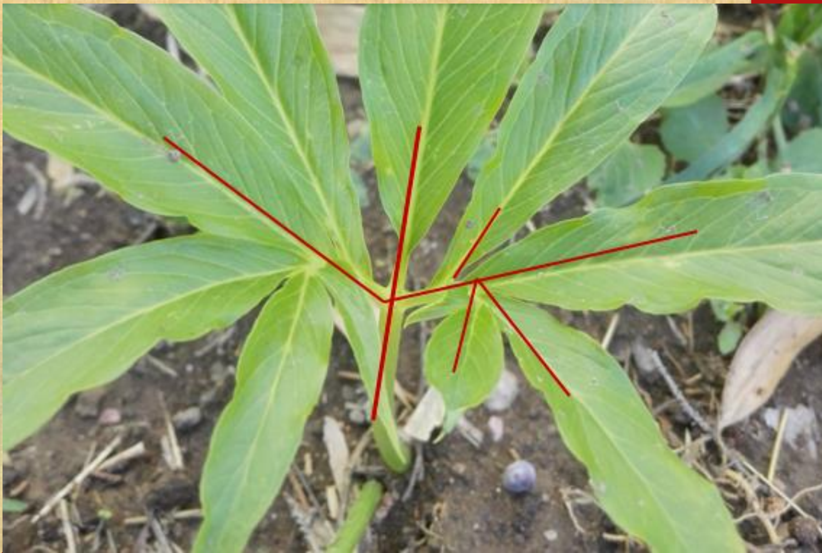
虎掌（南星），叶片 鸟足状分裂，裂片6-11，披针形。