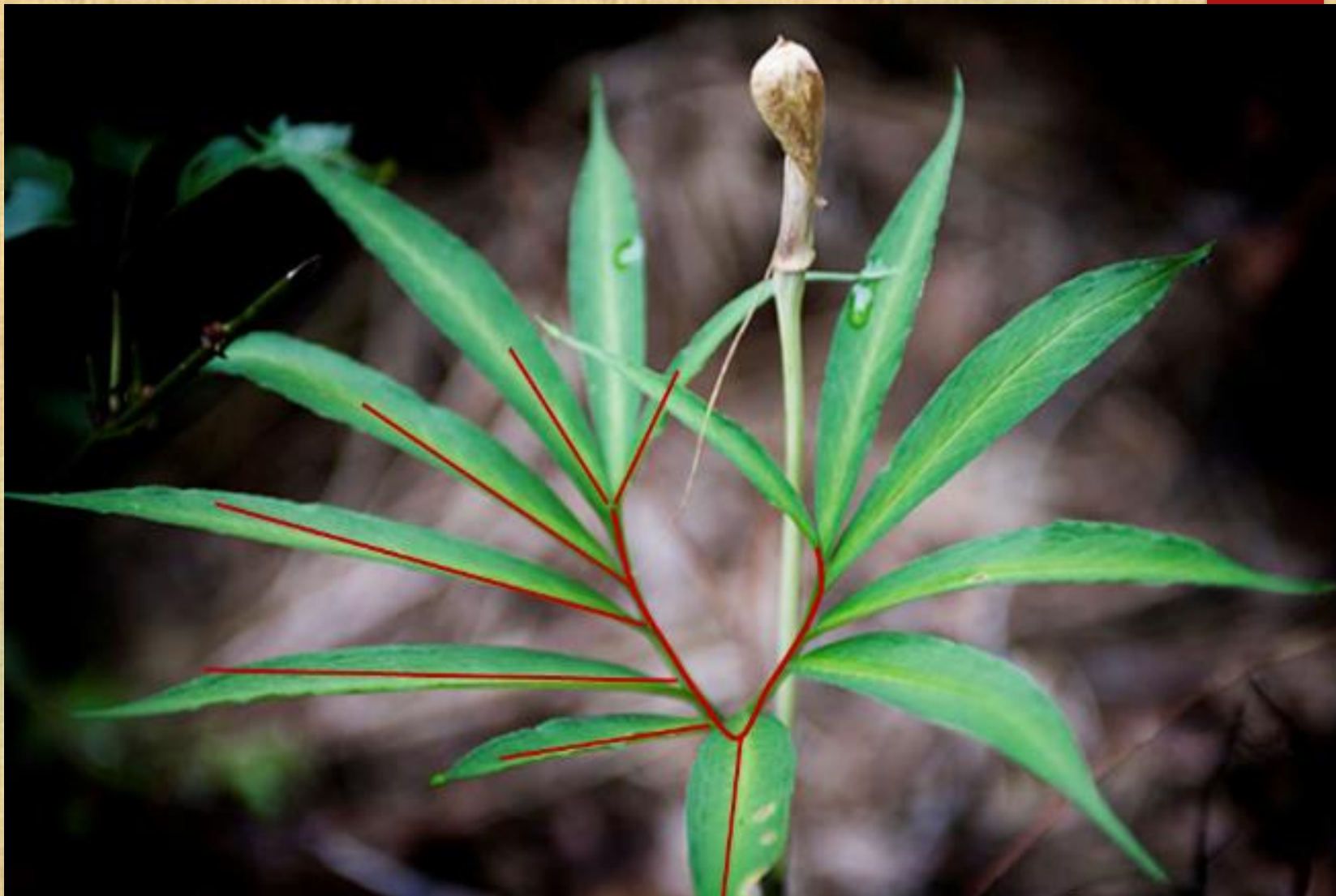
天南星叶片鸟足状分裂，裂片13-19，有时更少或更多；向外渐小，排列成蝎尾状。