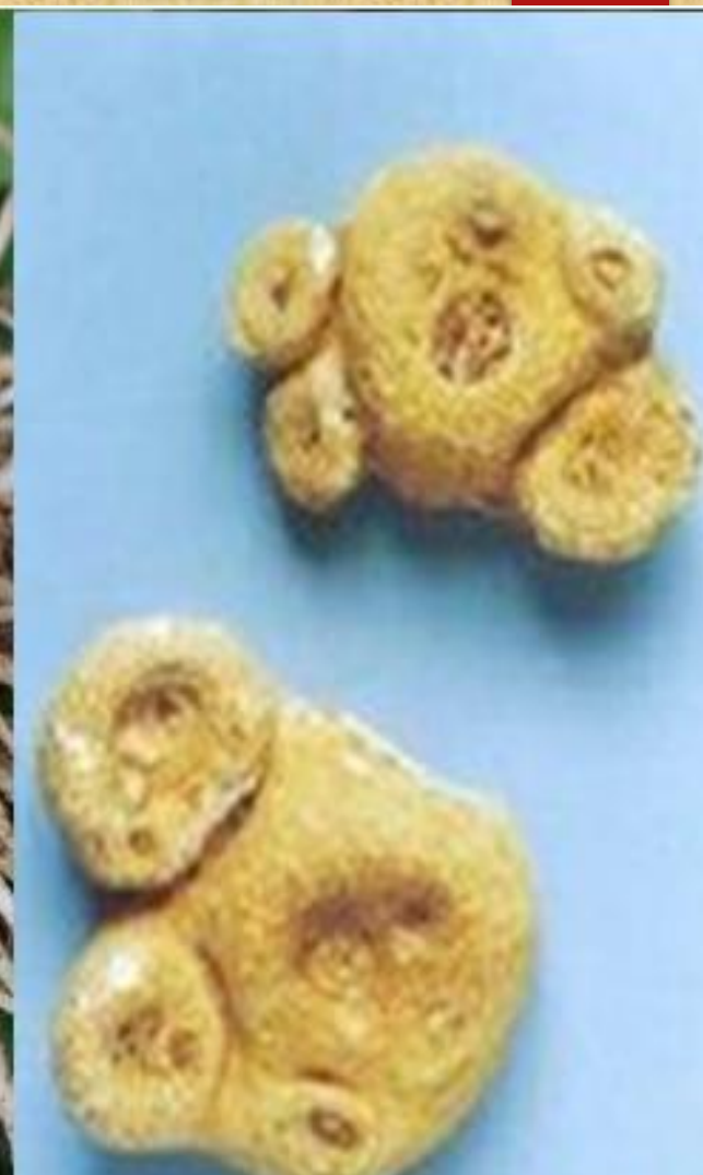
虎掌块茎近圆球形，直径可达4厘米，块茎四旁常生小球茎。