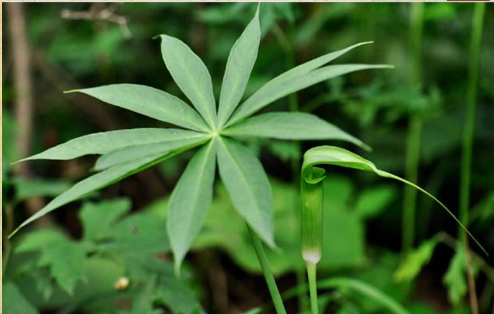
一把伞南星，叶片放射状分裂，裂片无定数，披针形、长圆形至椭圆形，无柄。佛焰包绿色，背面有清晰的白色条纹。