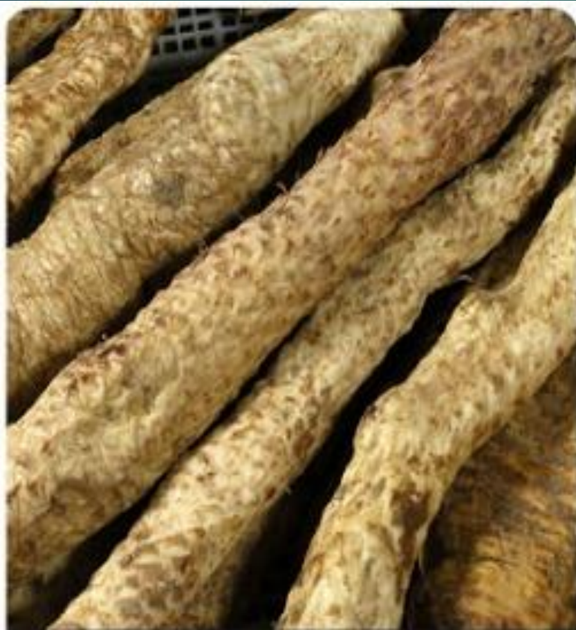
新鲜刚采挖的整根肉苁蓉