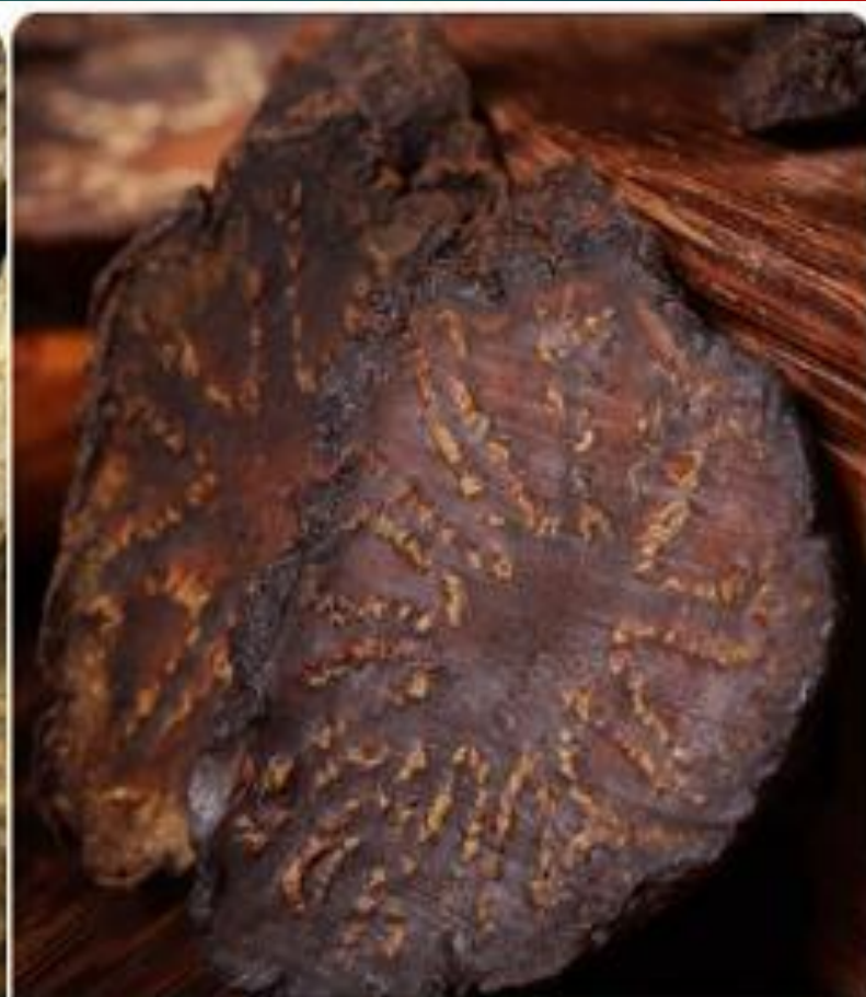
约 7 斤鲜苁蓉晾成 1 斤精选片