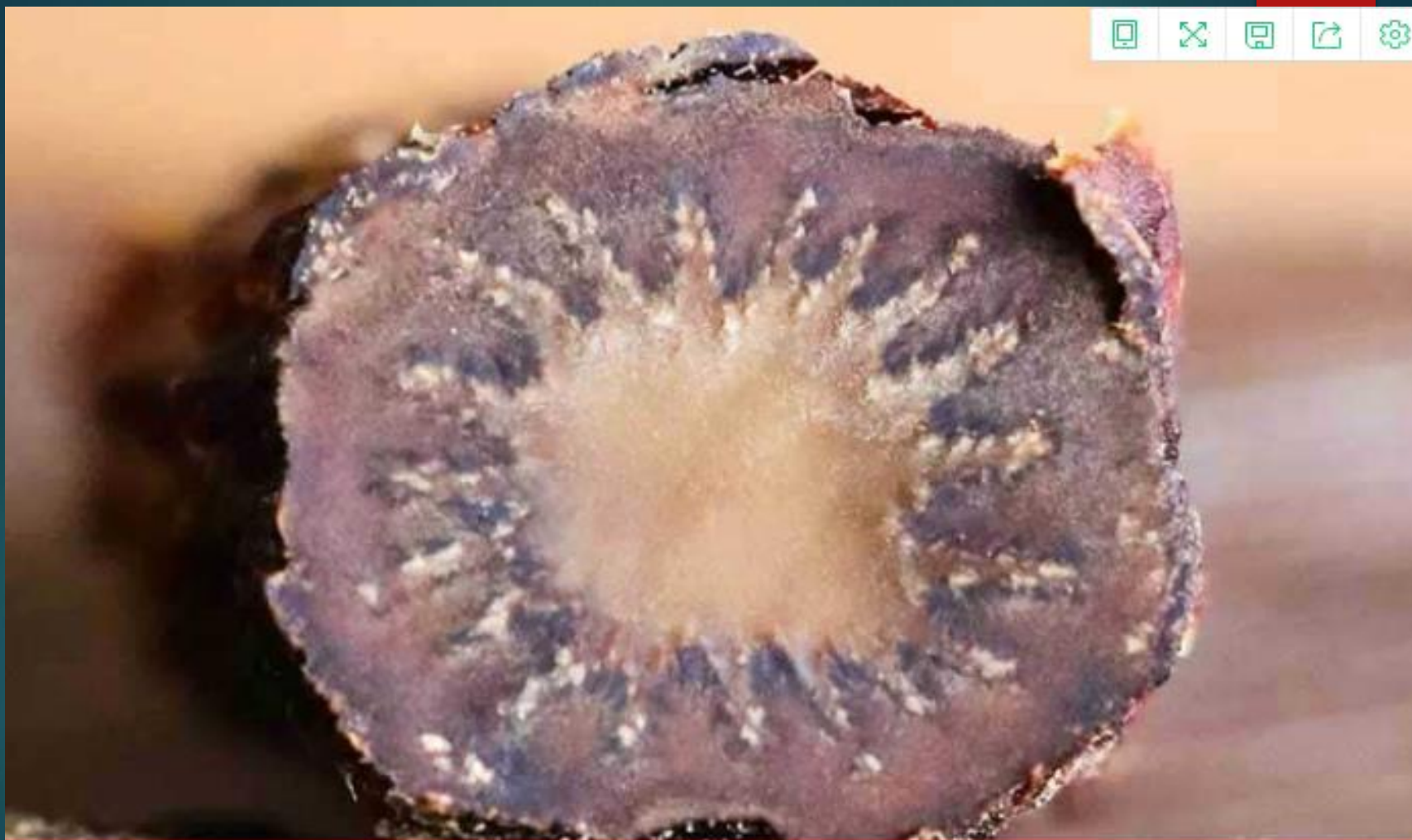
晾晒干的肉苁蓉片 切面维管束波浪环状排列