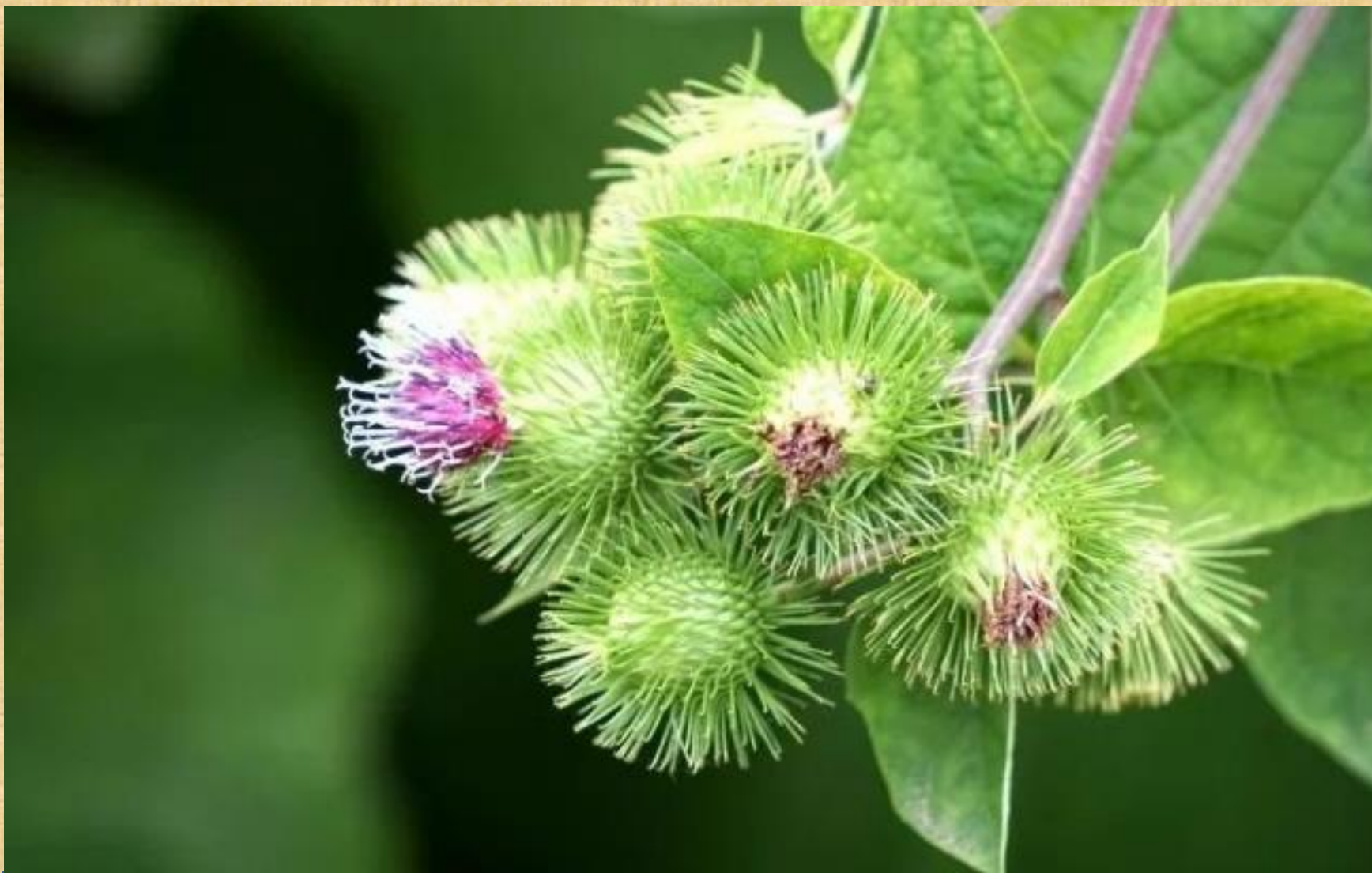
牛蒡子，菊科植物牛蒡的干燥成熟果实。别名：大力子、鼠黏子、牛子、恶实。