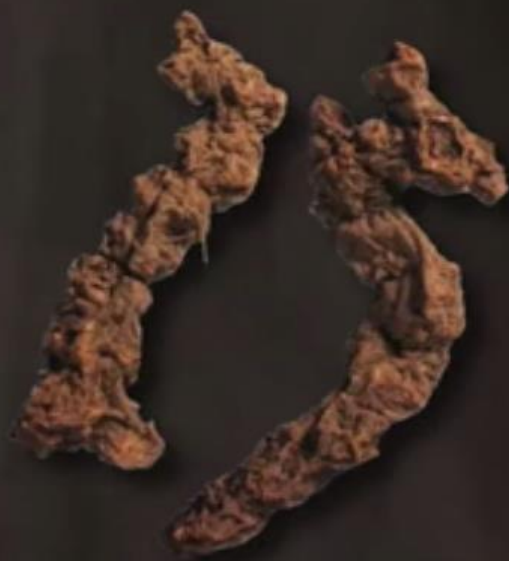
北苍术：呈疙瘩块状或结节状圆柱形， 表面黑棕色。