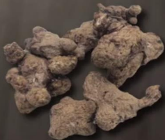
茅苍术：表面呈灰棕色， 有皱纹及残留须根。