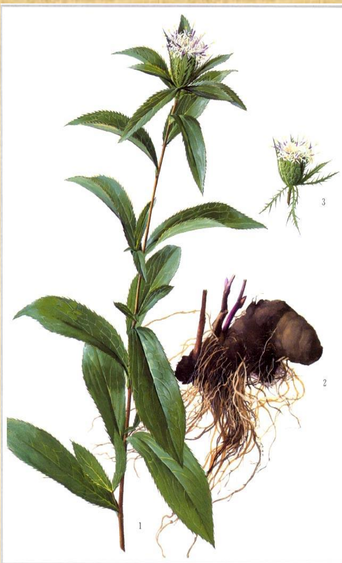
茅苍术 Atractylodes lancea (Thunb.) DC. (李增礼绘) 1. 着花植株 2. 根茎 3. 头状花序

苍术为菊科植物茅苍术或北苍术的干燥根茎。前者主产于江苏、湖北、河南等地，以产于江苏茅山一带者质量最好，故名茅苍术。后者主产于内蒙古、山西、辽宁等地。春、秋二季采挖，晒干。切片，生用、麸炒或米泔水炒用。苍术，苍者，陶弘景因本品根“色苍黑”，故名苍；术者，李时珍“按六书本义，术字篆文，象其根干枝叶之形”。故而，名曰苍术。由此看来，苍术(zhu)，并非苍白无术(shu)之意。苍术实乃有术、多术，甚至可称之为仙术。医圣张仲景曾感叹世相说，“怪当今居世之士，曾不留神医药，精究方术，但竞逐荣势，惟名利是务，”这简直远远不抵苍术，可谓真正的无德又无术了。燥湿，健脾，明目，辟一切恶气。